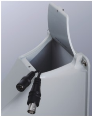
隱藏式線槽，可放置電源變壓器