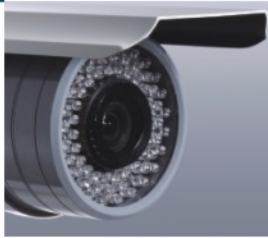
70個紅外線發光二極體