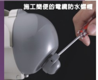
施工簡便的電纜防水螺帽