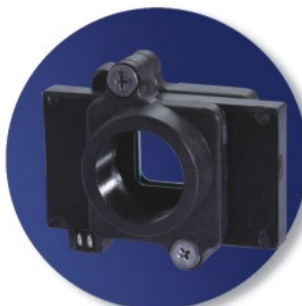
內建雙濾光片自動切換裝置