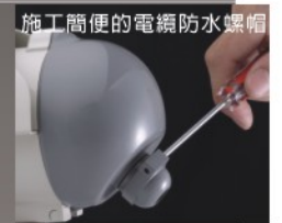
施工簡便的電纜防水螺帽