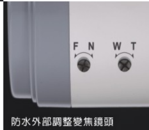
防水外部調整變焦鏡頭

專利字號： M256960, M309690 M294796, M342525 I313561